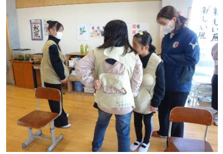
不審者対応避難訓練 2/5