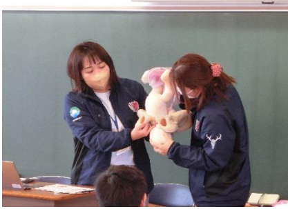
5 2 1 年 生 命 の 誕 生