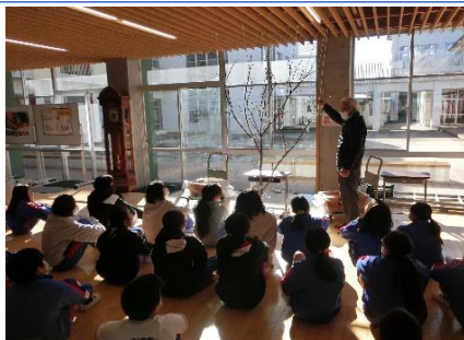
1 / 1 せ 2 餅

※1月8号発行日の都合より、本誌9号と次誌10号は月半ばの発行とさせていただきます。