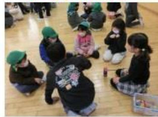
スクールサポートスタッフの方と給食配膳員に感謝する会